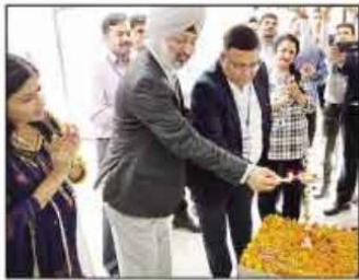
नई शाखा का उद्घाटन करते मुख्य अतिथि

मौजूदा आउटस्टैंडिंग पोर्टफोलियो तीन हजार करोड़ रुपये से भी अधिक है। कुल डिपॉजिट दो हजार करोड़ रुपये से ज्यादा है। आशा है कि वित्तीय वर्ष 2019 के अंत तक बैंक का व्यवसाय 11 हजार करोड़ से ज्यादा होगा।